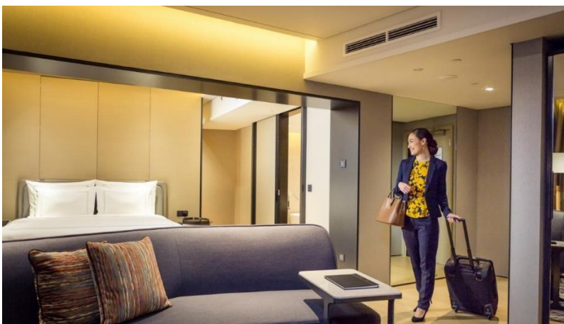
Czujniki ruchu włączają światło automatycznie po wykryciu, że w pokoju ktoś się znajduje