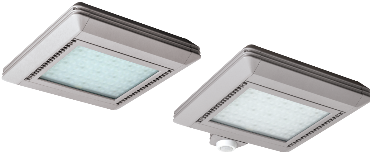
SFC luminaire pour auvent/plafond