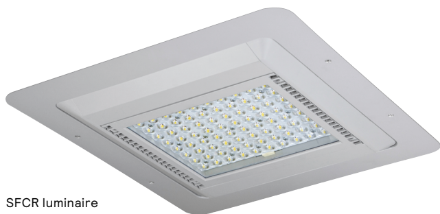
SFCR luminaire pour auvent/plafond