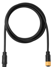
ZXP399 4P Jumper Cable