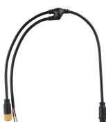
ZXP399 Y Connector