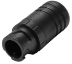
ZXP399 Endcap F