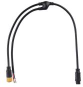
ZXP399 Y Connector