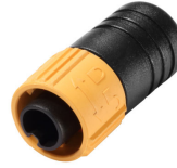
ZXP399 Endcap M