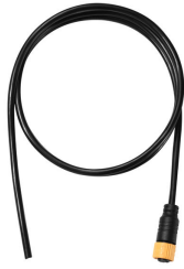
ZXP399 4P Leader Cable