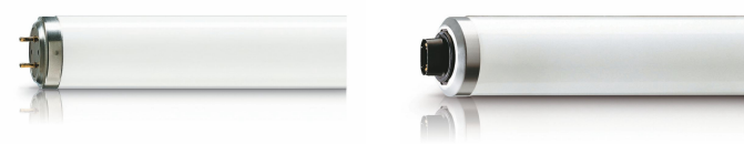
XPPR XUMTLRS G13