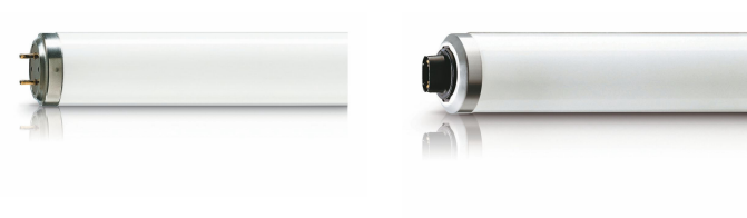
XPPR XUMTLRS G13