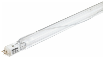
TUV Dynapower 335W