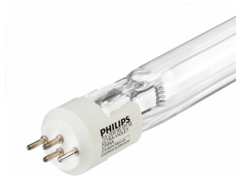
TUV Dynapower 230W