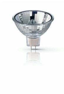
XPPR XHOPDI 0001