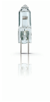
XPPR XHMPSEFF 0003