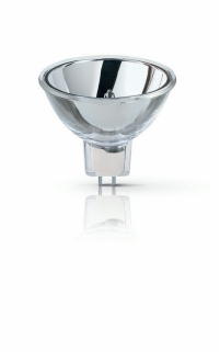
XPPR XHOPDI 0002