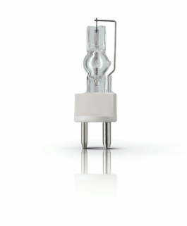
XPPR XDMSR 0017