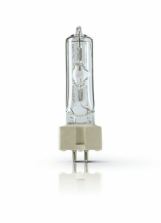
XPPR XDMSR 0025