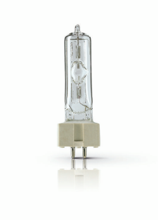
XPPR XDMSR 0025