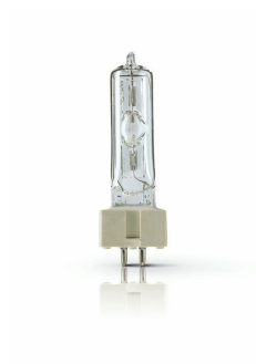
XPPR XDMSR 0025