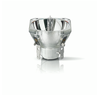
XPPR XDMSD 0010