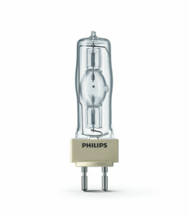
XPPR XDMSD 0013