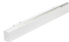
TrueLine Wallmounted- WL532W- detail