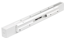
TrueLine Wallmounted- WL532W- detail