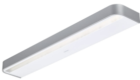
SmartBalance Wallmounted- WL484W