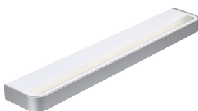
SmartBalance Wallmounted- WL484W- detail