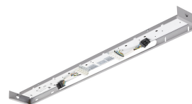
SmartBalance Wallmounted- WL484W- detail