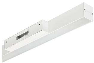
KeyLine Wallmounted- WL350W- detail