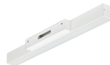
KeyLine Wallmounted- WL350W- detail