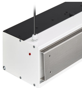
Wall mounting plate and indicator light