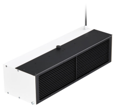
UV-C disinfection upper air Wall mounted version