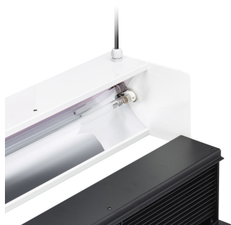
Access to lamp and product maintenance