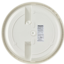
Ledinaire wall-mounted gen2 WL070V back view