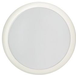
Ledinaire wall-mounted gen2 WL070V top view