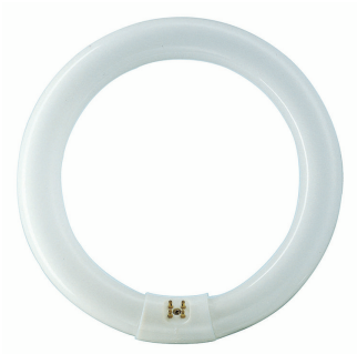
LPPR TL-E8 G10q