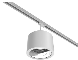
Drum Track-mounted Suspended Downlight