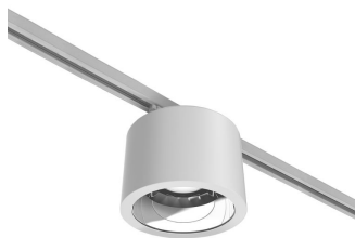
Drum Track-mounted Downlight