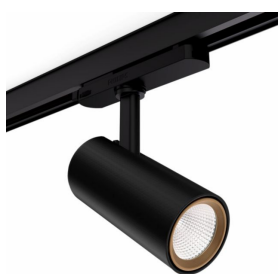
D65-SPOT-R-T102- SHADE-BK402-RING- BS410-A