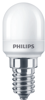
LED T25 E14 WW C1 POS1