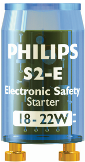
LPPR STARTER S2E BL PHL