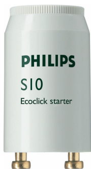
LPPR STARTER 0001