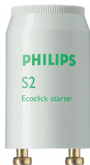
LPPR STARTER PHL 0004