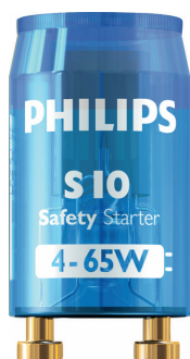
LPPR STARTER PHL 0003