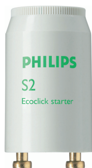
LPPR STARTER PHL 0004