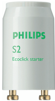
LPPR STARTER PHL 0004