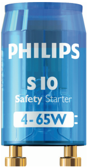
LPPR STARTER PHL 0003