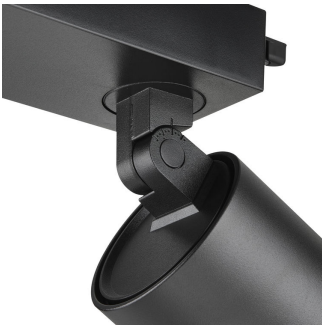
Aiming indication, with marking for Indoor Positioning operation