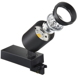
StyliD Evo Exploded View