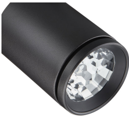
OptiShield protects the optical compartment from bugs and dust