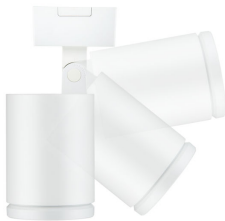
StyliD Evo Compact in black, full rotation flexibility