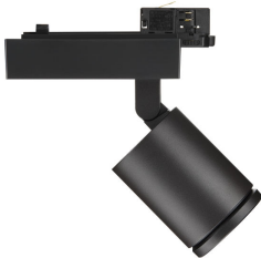
StyliD Evo Compact black, side view