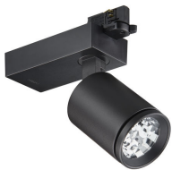
StyliD Evo Compact ST770T black, track version