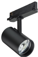
ST714T BK 12S TrueFashion2 compact-driver-in-track