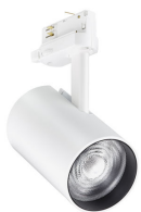
ST715T WH TrueFashion2 compact