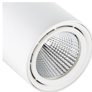
ST321T - GreenSpace Accent Projector RPO plastic white