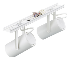
ST321Y - GreenSpace Accent Projector Coreline trunking connect