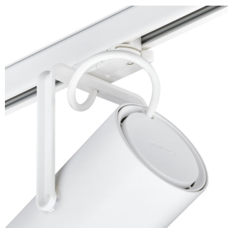
ST321T - GreenSpace Accent Projector back view white