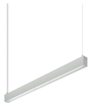
TrueLine suspended-SP530P SP532P L1130 ALU