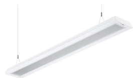
FlexBlend Suspended-SM340C- MLO-WH-SENS1-L150