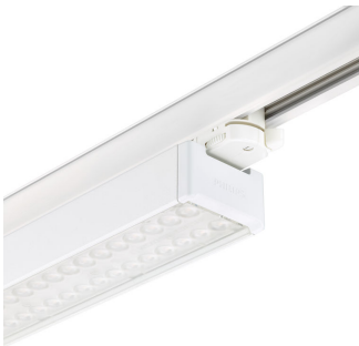
StoreSet Linear close-up track adaptor + endcap, white