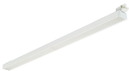
StoreSet Linear full length, white