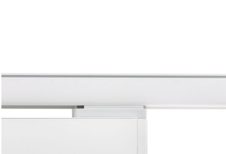
StoreSet Linear close-up mech adaptor on track, white