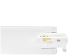
StoreSet Linear top view track adaptor, white