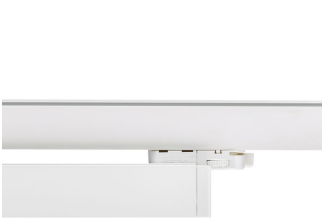
StoreSet Linear close-up track adaptor on track, white