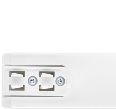
StoreSet Linear top view mechanical adaptor, white