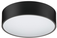
TrueCircle Surface SM250B PSP BK D380_SPP