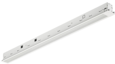
TrueLineRecessed VPC OC IP RTP