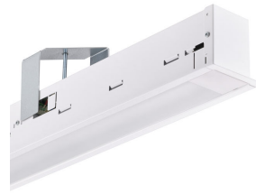
TrueLine_Recessed IP DP