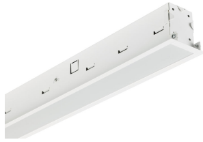
TrueLineRecessed NOC OPTICS DP