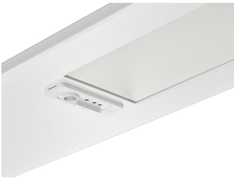
TrueBlend Recessed U4 sensor