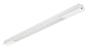
TrueBlend Recessed RC455B MLO U4