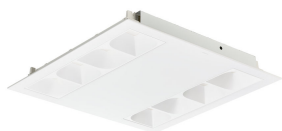
PowerBalance RC360B W60L60 CWL