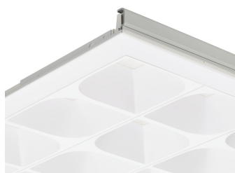
PowerBalance LEAF DP