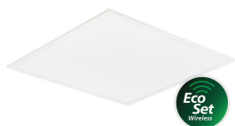
Philips Ledinaire panel EcoSet panel