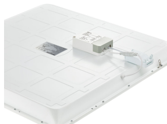
Ledinaire panel Ecoset-backplate_1