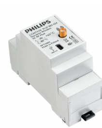
RF Segment controller Module