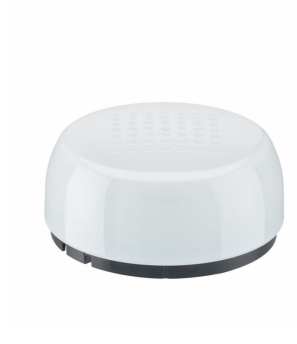
ZHAGA ; CE only; Light grey, light sensor, GPS