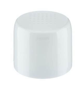
NEMA 5PIN AC LV; IEC only Light Grey, light sensor, GPS