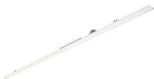
Maxos Fusion Panel-LL523X WB WH