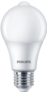
LED Sensor A60 E27 WW POS1