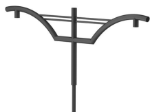
Reverbere DA bracket-JSP105 S900