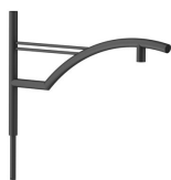
Reverbere SA bracket-JSP105 S1150