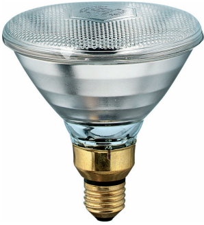
LPPR IRPR38 0001