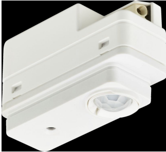
SC200B Sensor White