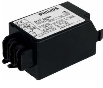
GPPR SI 0001