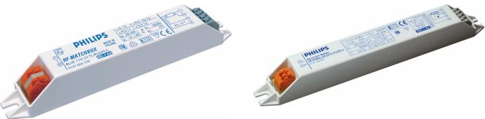
GPPR MTL-LH 0001